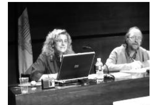
2006 Correllengua al Parc Central