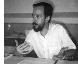
1994, a la 7a Diada Andorrana a l'UCE de Prada