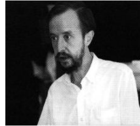
1996, a la 9a Diada Andorrana a l'UCE de Prada

Expresident de la Societat Andorrana de Ciències